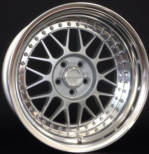
CLASSIC SILVER (クラシックシルバー) 16inch