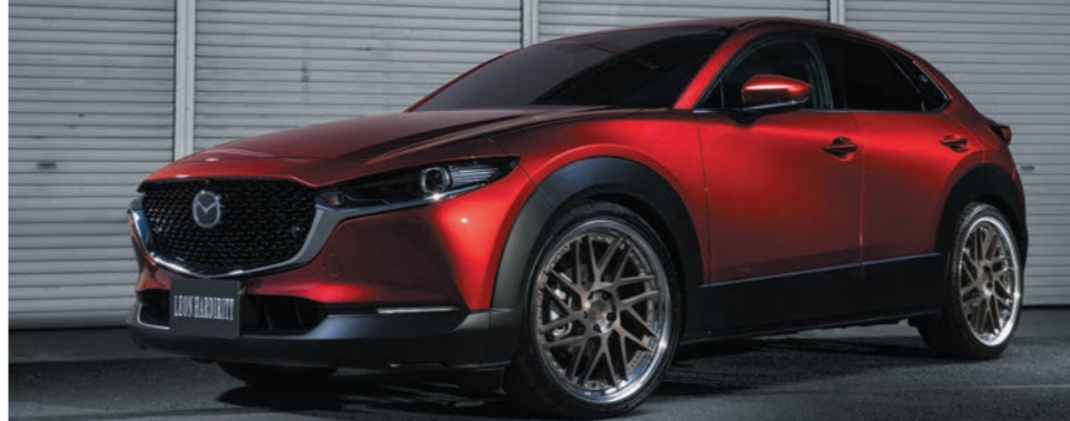
MAZDA CX-30 COLOR : MATTE BRONZE BRUSHED NORMAL RIM P.C.D : 5-114.3 SIZE : F/R 2190 INSET 42 245/35-21 ※ローダウンが必要です。

※カラークリアーは、ロットにより色の濃さが変わる可能性があります。ご了承ください。