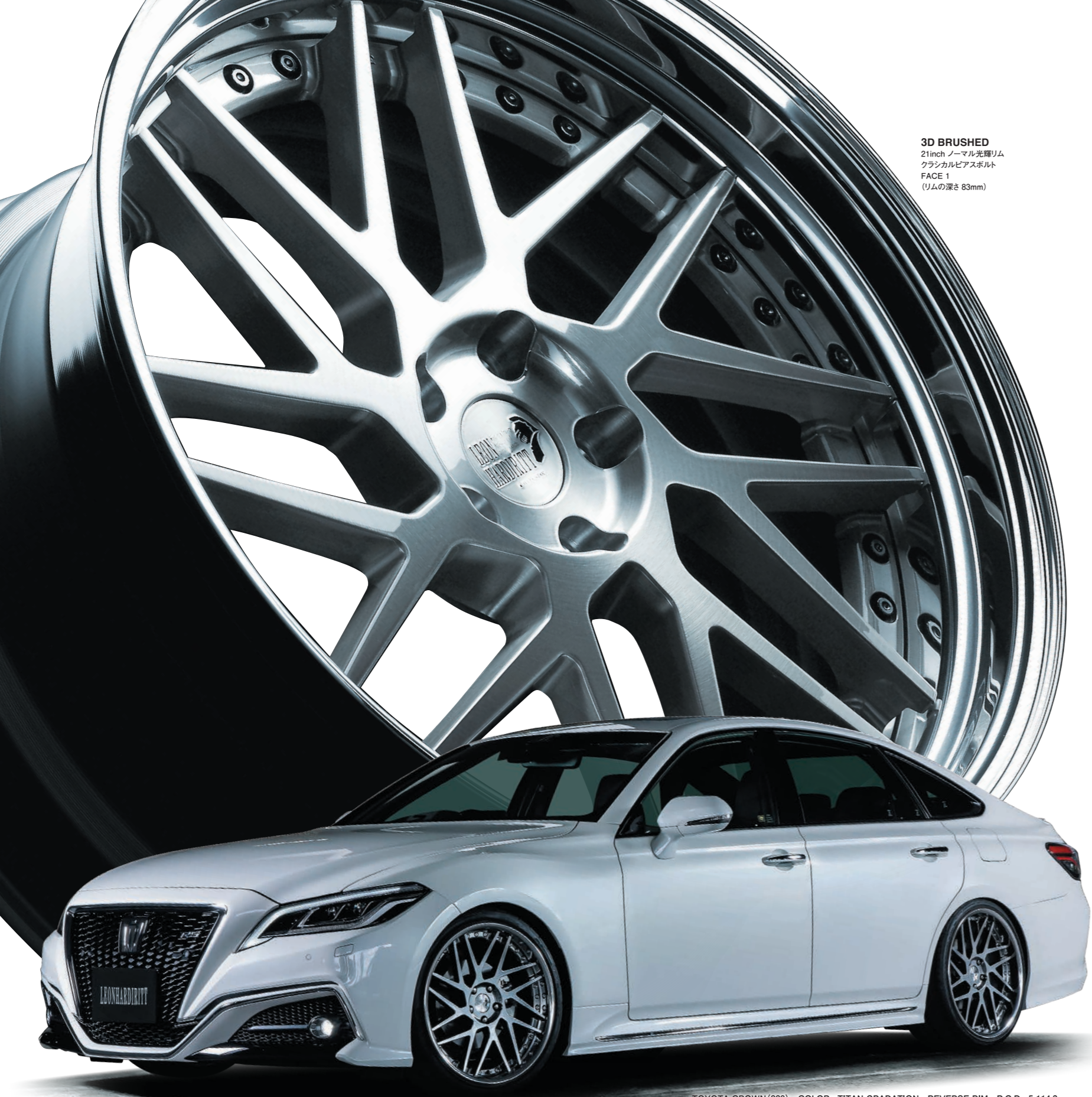
3D BRUSHED 21inch ノーマル光輝リム クラシカルピアスボルト FACE 1 (リムの深さ 83mm)