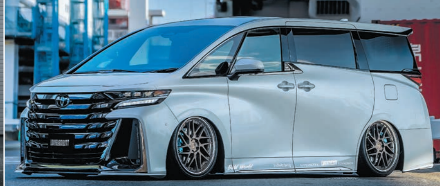
TOYOTA VELLFIRE (40) COLOR : MATTE BRONZE BRUSHED NORMAL RIM P.C.D : 5-120 PIERCE BOLT : TITAN HEAT SIZE : F 2190 INSET 35 245/35-21 R 2190 INSET 22 245/35-21 (F 6mm SPACER INSERT) ※ノーマル車両には装着できません。