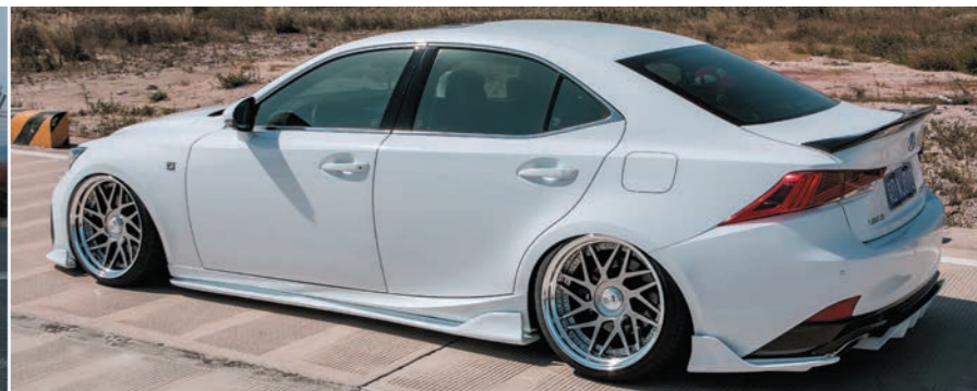
LEXUS IS (30) COLOR : TITAN GRADATION NORMAL RIM P.C.D : 5-114.3 SIZE : F 1995 INSET 16 225/35-19 R 19105 INSET 10 235/35-19 ※ノーマル車両には装着できません。