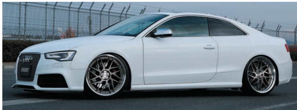
AUDI RS5 COLOR : MATTE BRONZE BRUSHED NORMAL RIM P.C.D : 5-112 SIZE : F 2195 INSET 24 255/30-21 R 2195 INSET 28 255/30-21 ※ローダウンが必要です。