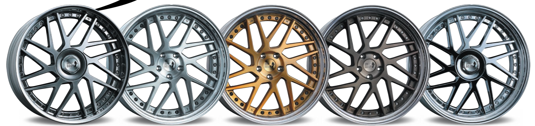
TITAN GRADATION 20inch ノーマル光輝リム FACE 2 (リムの深さ 83mm)