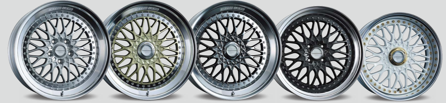
OPEN TYPE / CLASSIC SILVER 18inch ノーマルリム / ダブルステップ (リムの深さ 83mm) COVERED TYPE / PLATINUM GOLD 18inch ノーマルリム / ダブルステップ (リムの深さ 83mm) COVERED TYPE / SBC 18inch ノーマルリム / ダブルステップ (リムの深さ 83mm) ※SBCはカバードタイプのみ(4-98は対応不可) ペース価格 + ¥31,900UP (税抜 ¥29,000UP) OPEN TYPE / MATTE CARBON 17inch ノーマルリム (リムの深さ 77mm) COVERED TYPE / WHITE 16inch リバースリム / ゴールドピアスボルト / ゴールドクロムキャップ (リムの深さ 77mm)