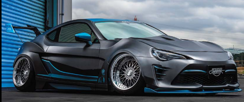
TOYOTA 86 COLOR: SBC REVERSE RIM P.C.D: 5-100 SIZE: F/R 18100 INSET -30 225/40-18 (F 30mm, R 45mm SPACER INSERT) ※ノーマル車両には装着できません。

M2 (COVERD) SBC 19inch / ノーマル光輝リム (リムの深さ 70mm)