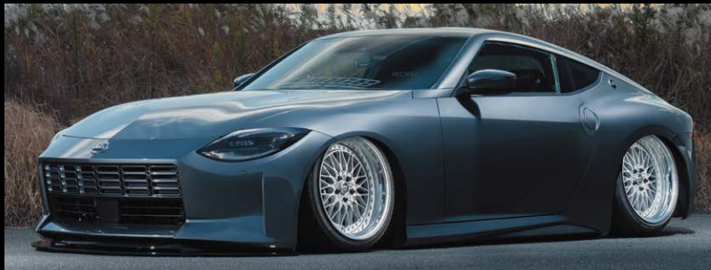
NISSAN FAIRLADY Z (RZ34) COLOR: CLASSIC SILVER NORMAL RIM PIERCE BOLT: CLASSICAL P.C.D: 5-114.3 SIZE: F 19100 INSET 16 245/35-19 R 19100 INSET -4 255/35-19 ※ノーマル車両には装着できません。