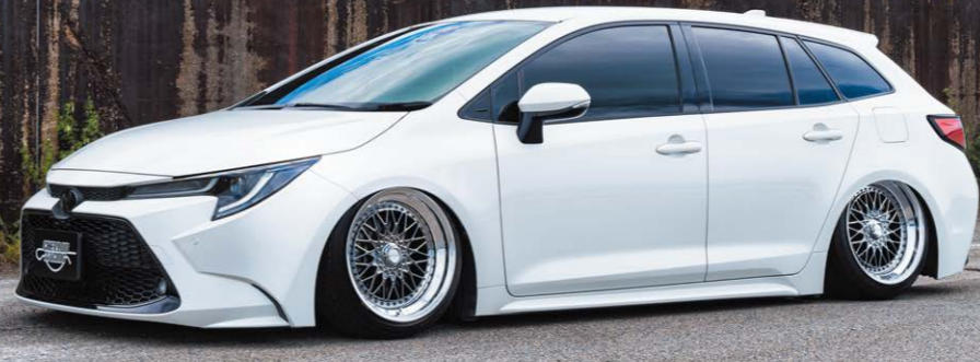
TOYOTA COROLLA TOURING COLOR : SBC NORMAL RIM (DOUBLE STEP) PIERCE BOLT : CLASSICAL P.C.D. : 5-100 SIZE : F 1890 INSET 20 215/40-18 R 1890 INSET 20 225/40-18 ※ノーマル車両には装着できません。