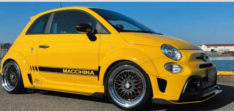
ABARTH 595 COMPETIZIONE COLOR : MATTE CARBON NORMAL RIM P.C.D. : 4-98 SIZE : F 1785 INSET 18 205/40-17 R 1785 INSET 20 205/40-17 ※オーバーフンダー(25mm)が必要です。