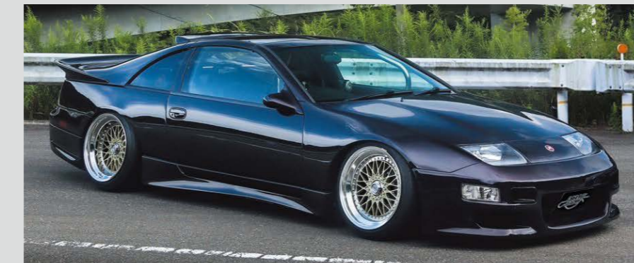
NISSAN FAIRLADY Z (Z32) COLOR : PLATINUM GOLD NORMAL RIM (DOUBLE STEP) P.C.D. : 5-114.3 SIZE : F 1895 INSET 5 215/40-18 R 18105 INSET 5 225/40-18 ※ノーマル車両には装着できません。