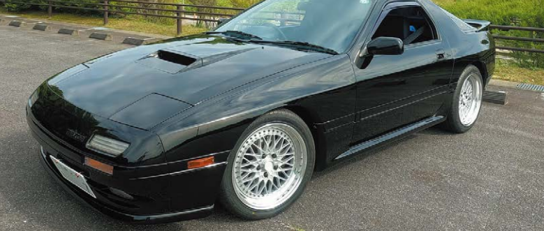
MAZDA RX-7 (FC3S) COLOR : CLASSIC SILVER P.C.D. : 5-114.3 PIERCE BOLT : CLASSICAL SIZE : F 17-75 INSET 32 215/45-17 R 17-85 INSET 31 235/40-17 ※ローダウンが必要です。