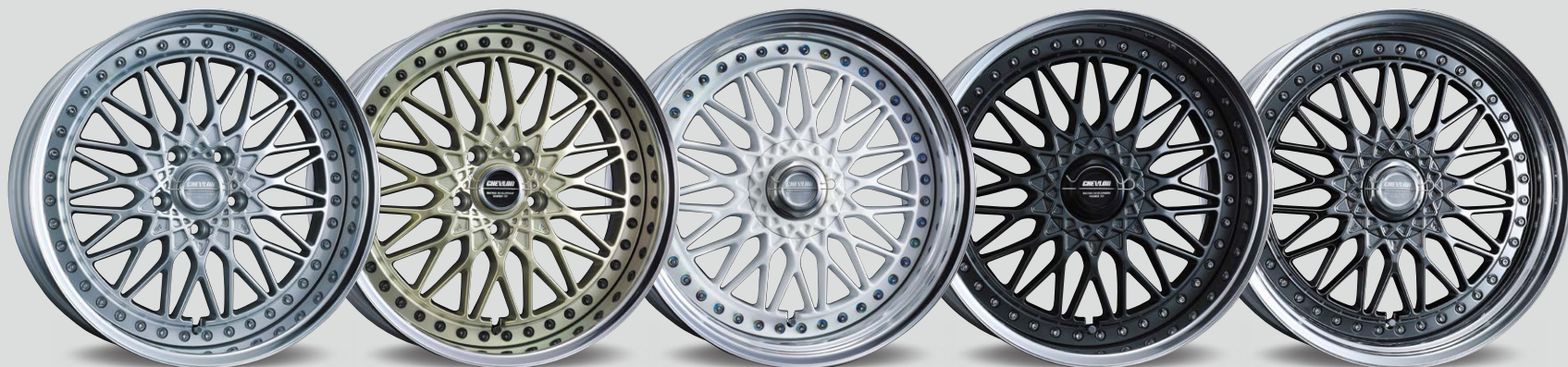
M2 (OPEN) / CLASSIC SILVER 18inch / リバース光輝リム (リムの深さ 70mm)