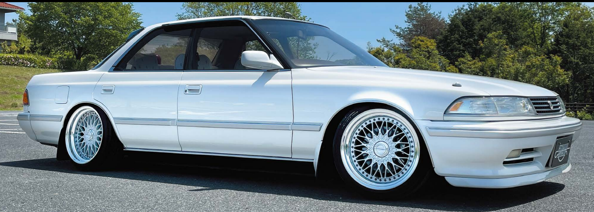
TOYOTA MARK 2 (GX81) COLOR : CLASSIC SILVER NORMAL RIM PIERCE BOLT : CLASSICAL P.C.D. : 5-114.3 F 1790 INSET 26 195/45-17 R 1795 INSET 20 215/40-17 ※ノーマル車両には装着できません。

OH (Over Head) (16/17inch) UH (Under Head) (18inch)