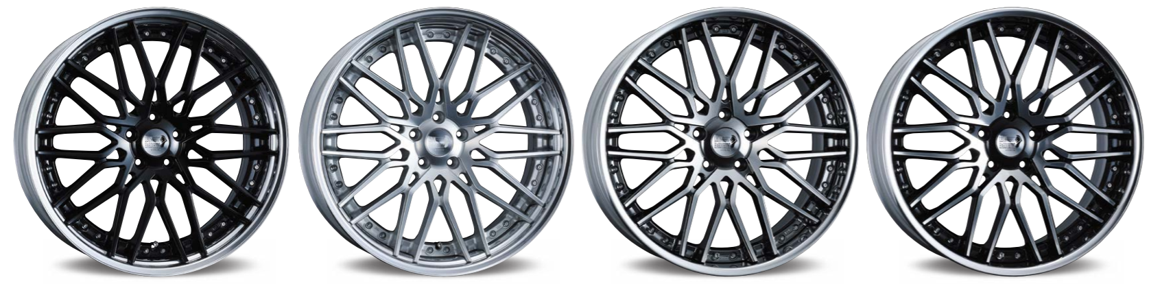
PIANO BLACK 22inch/ノーマル光輝リム (リムオーバーディスク) (リムの深さ 69mm)