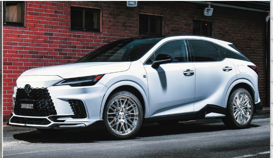
LEXUS RX COLOR: LUSTER SILVER POLISH REVERSE RIM P.C.D.: 5-114.3 SIZE: F/R 2185 INSET 35 235/50-21