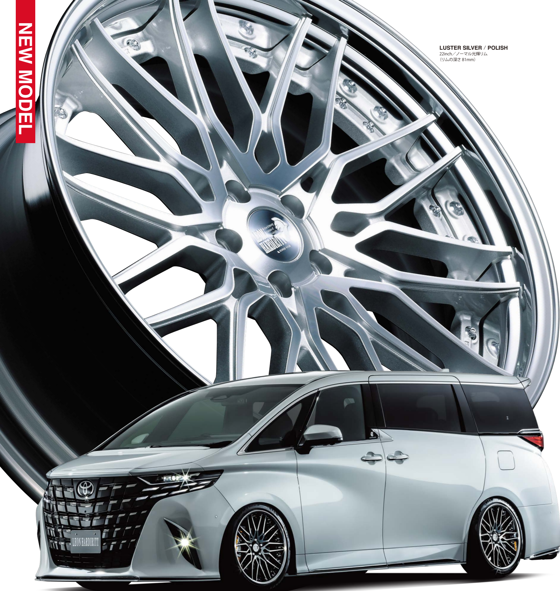
LUSTER SILVER / POLISH 22inch/ノーマル光輝リム (リムの深さ 81mm)