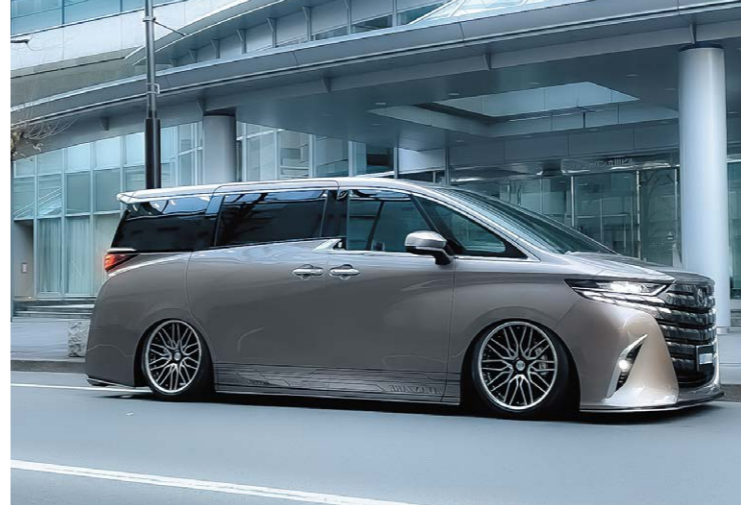
TOYOTA ALPHARD (40) COLOR: BLACK/BUFF REVERSE RIM P.C.D.: 5-120 SIZE: F/R 2195 INSET 35 245/40-21 ※ノーマル車両には装着できません。