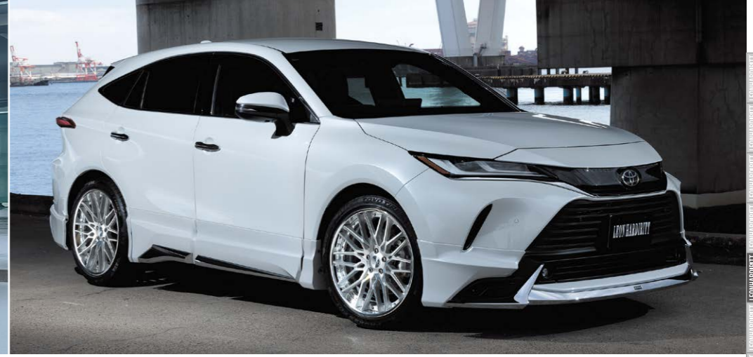
TOYOTA HARRIER (80) COLOR: LUSTER SILVER POLISH REVERSE RIM PIERCE BOLT: TITAN HEAT P.C.D.: 5-114.3 SIZE: F/R 2190 INSET 42 245/40-21