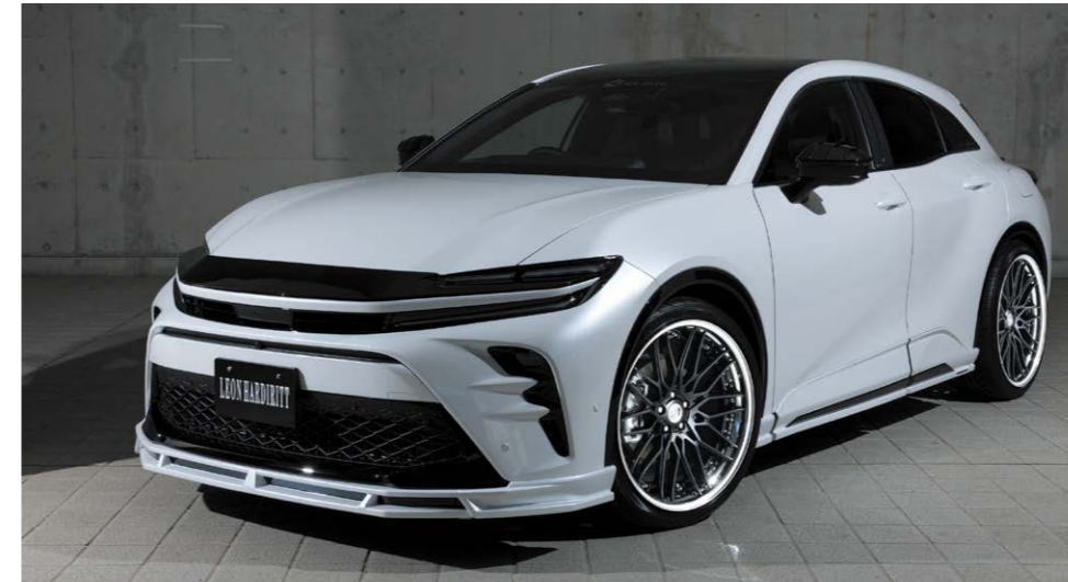
TOYOTA CROWN SPORT COLOR: PIANO BLACK NORMAL RIM PIERCE BOLT: CHROME P.C.D.: 5-114.3 SIZE: F/R 2295 INSET 36 255/35-22