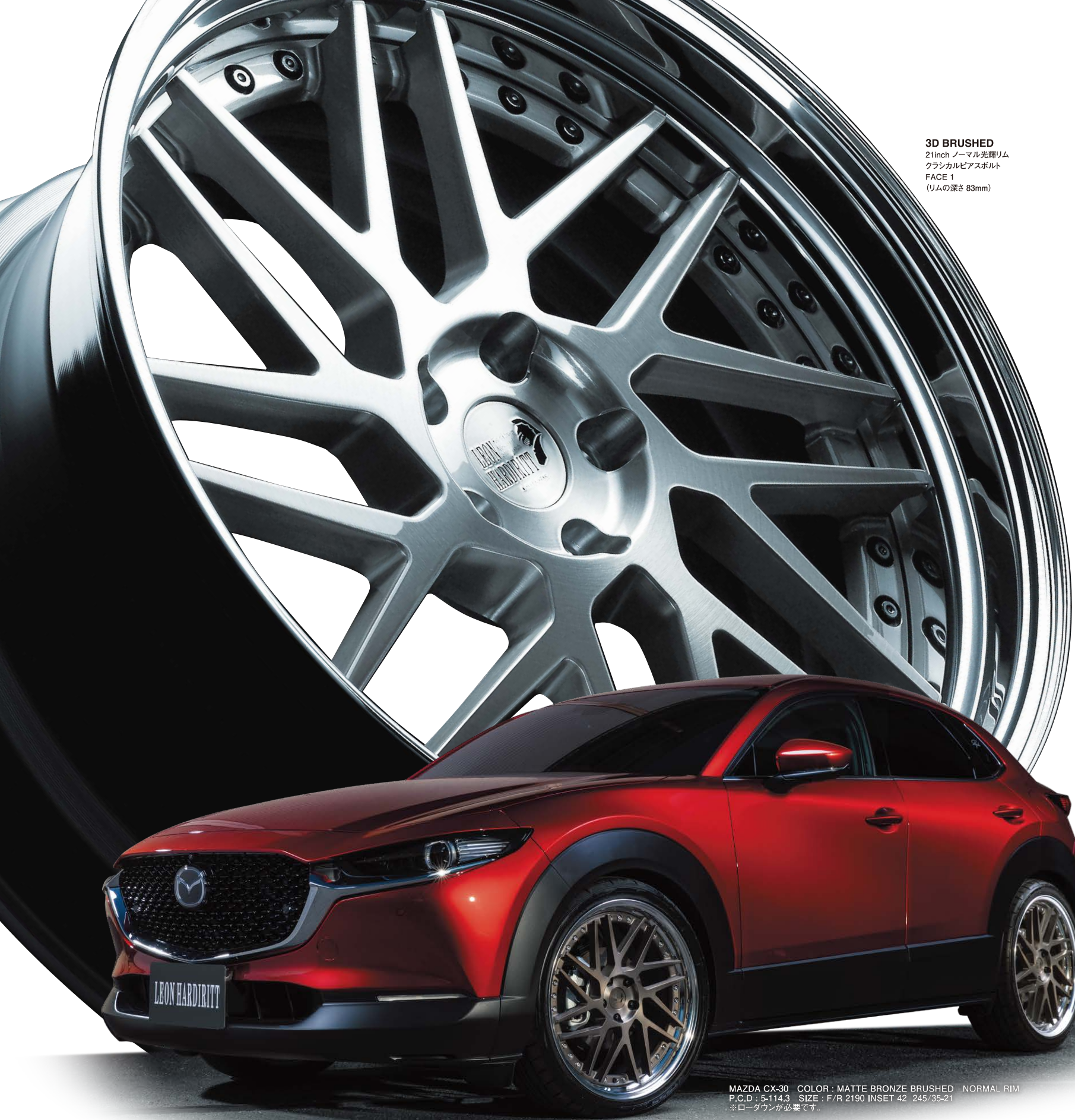
3D BRUSHED 21inch ノーマル光輝リム クラシカルピアスボルト FACE 1 (リムの深さ 83mm)