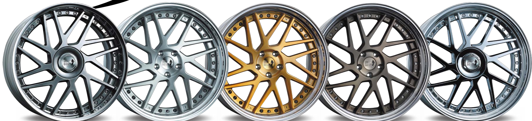
TITAN GRADATION 20inch ノーマル光輝リム FACE 2 (リムの深さ 83mm)