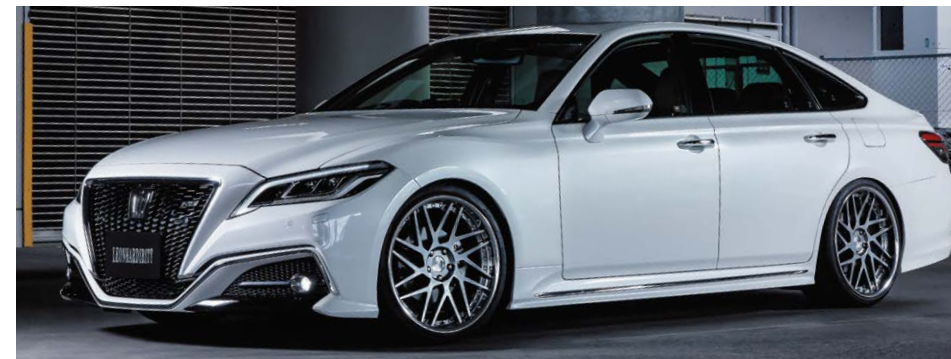
TOYOTA CROWN (220) COLOR : TITAN GRADATION REVERSE RIM P.C.D : 5-114.3 SIZE : F 2090 INSET 42 245/30-21 R 2010 INSET 42 255/30-20 ※ローダウンが必要です。