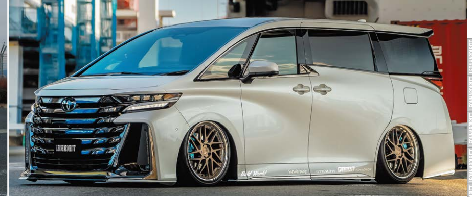
TOYOTA VELLFIRE (40) COLOR : MATTE BRONZE BRUSHED NORMAL RIM P.C.D : 5-120 PIERCE BOLT : TITAN HEAT SIZE : F 2190 INSET 35 245/35-21 R 2190 INSET 22 245/35-21 (F 6mm SPACER INSERT) ※ノーマル車間には装着できません。