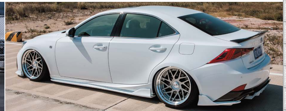
LEXUS IS (30) COLOR : TITAN GRADATION NORMAL RIM P.C.D : 5-114.3 SIZE : F 1995 INSET 16 225/35-19 R 19105 INSET 10 235/35-19 ※ノーマル車間には装着できません。