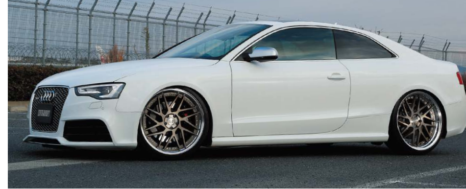
AUDI RS5 COLOR : MATTE BRONZE BRUSHED NORMAL RIM P.C.D : 5-112 SIZE : F 2195 INSET 24 255/30-21 R 2195 INSET 28 255/30-21 ※ローダウンが必要です。

※カラークリアーは、ロットにより色の濃さが変わる可能性があります。ご了承ください。