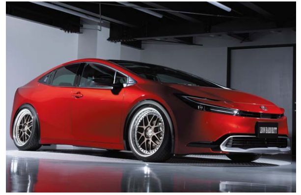
TOYOTA PRIUS (60) COLOR: UMBER BRONZE P.C.D.: 5-114.3 SIZE: F/R 2090 INSET 38 225/35-20 ※ノーマル車両には装着できません。