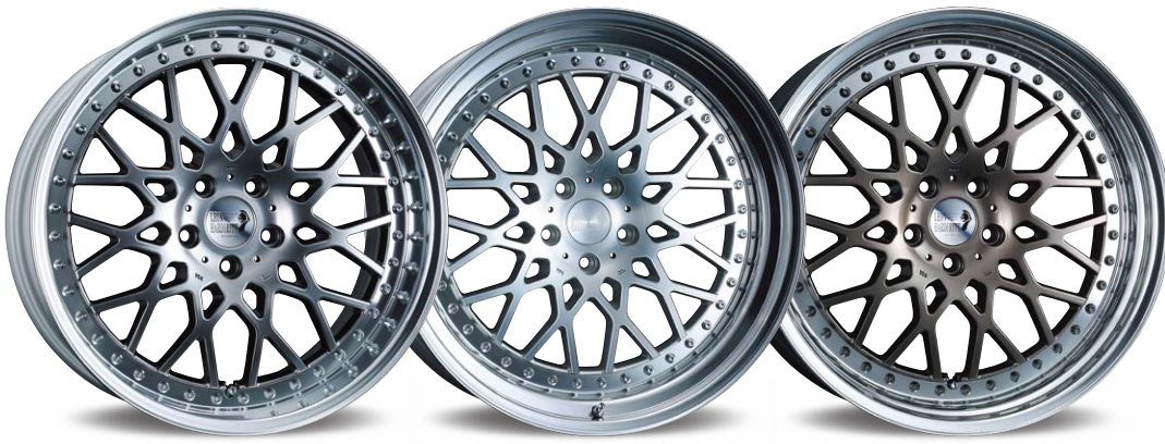
TITAN GRADATION 19inch リバース光輝リム (リムの深さ 82mm)