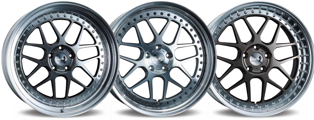
TITAN GRADATION 21inch ノーマル光輝リム(ダブルステップ) (リムの深さ 82mm)