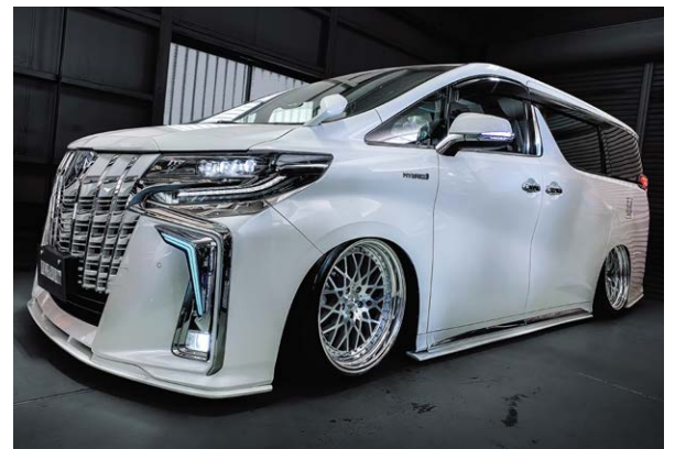
TOYOTA ALPHARD (30) COLOR: SILVER POLISH NORMAL RIM P.C.D.: 5-114.3 SIZE: F 20100 INSET 17 245/35-20 R 20100 INSET 12 245/35-20 ※ノーマル車両には装着できません。