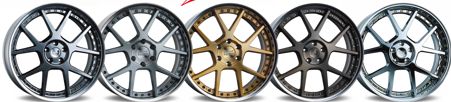
TITAN GRADATION リバス光輝リム (リムの深さ 70mm)