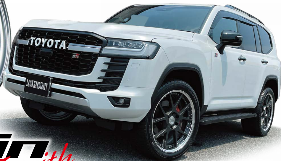
TOYOTA LAND CRUISER (300) GR SPORT COLOR : MATTE CARBON (ベース価格と同価格) REVERSE RIM P.C.D : 6-139.7 SIZE : F/R 22100 INSET 56 305/40-22

3D BRUSHED 24inch ノーマル光輝リム (5/150 FACE) (リムの深さ 70mm)