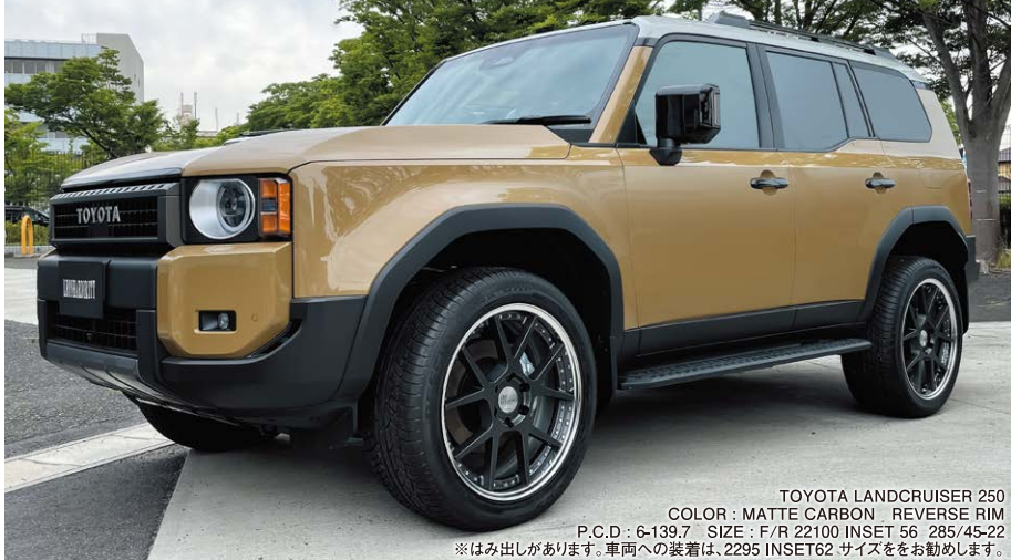
TOYOTA LANDCRUISER 250 COLOR : MATTE CARBON REVERSE RIM P.C.D : 6-139.7 SIZE : F/R 22100 INSET 56 285/45-22 ※はみ出しがあります。車両への装着は、2295 INSET62 サイズをお勧めします。