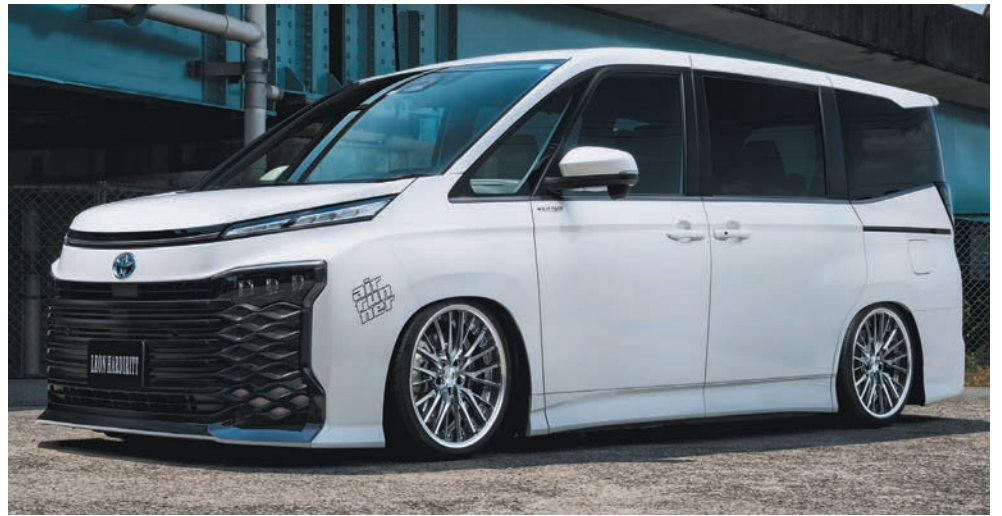
TOYOTA VOXY(90) COLOR : TITAN GRADATION REVERSE RIM P.C.D : 5-114.3 SIZE : F 1985 INSET 31(L) 225/35-19 R 1985 INSET 42(SL) 225/35-19 ※ノーマル車両には装着できません。