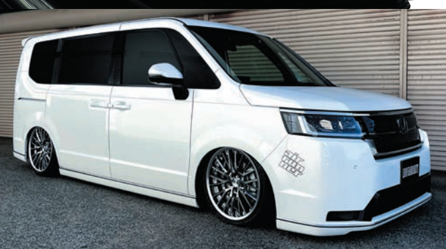
HONDA STEP WGN(RP8) COLOR : TITAN GRADATION REVERSE RIM P.C.D : 5-114.3 SIZE : F/R 1985 INSET 42 225/35-19 ※ローダウンが必要です。