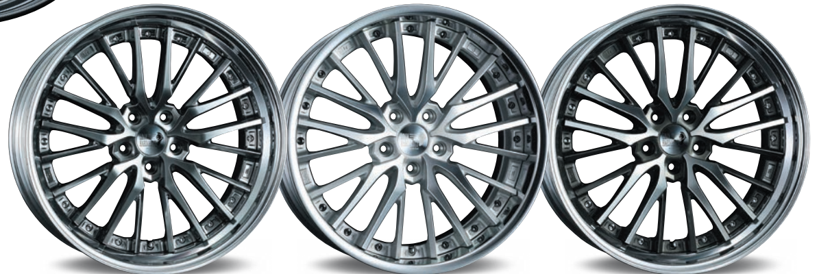
TITAN GRADATION 20inch ノーマル光輝リム (リムの深さ 80mm)