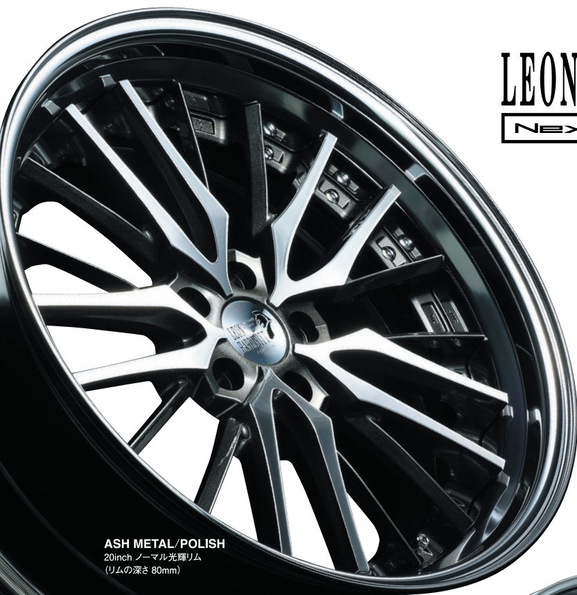
ASH METAL/POLISH 20inch ノーマル光輝リム (リムの深さ 80mm)